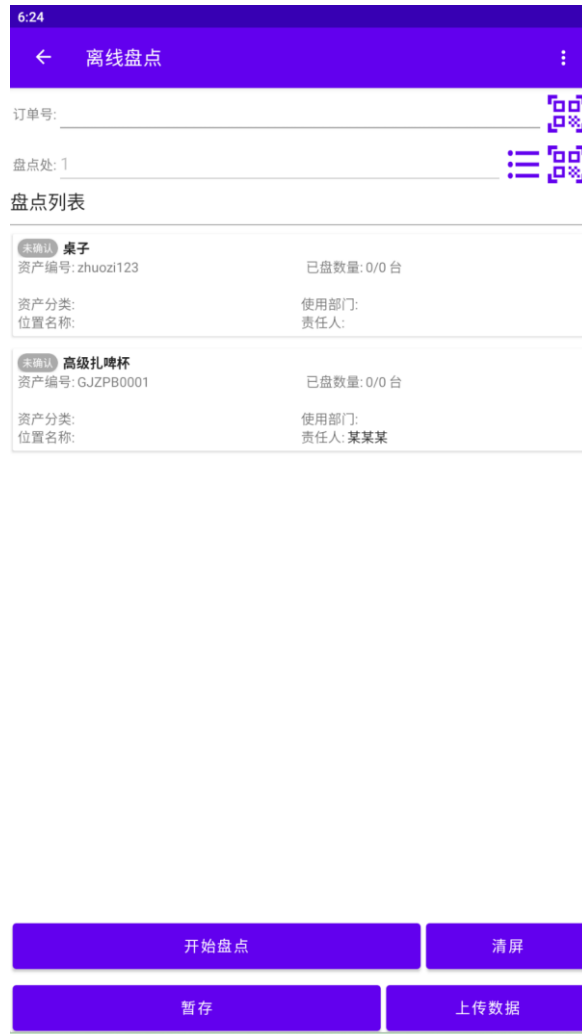
图 3-4 离线盘点资产页面