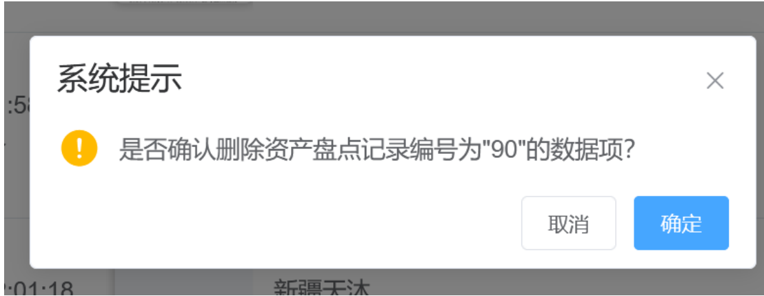
图 3-8 删除资产盘点计划窗口