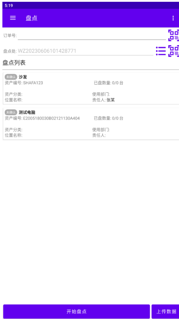
图 3-2 盘点资产界面