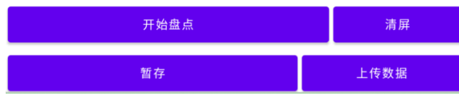
图 3-3 离线盘点页面