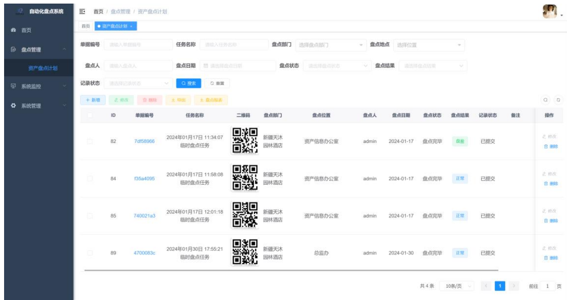
图 3-5 资产盘点计划页面