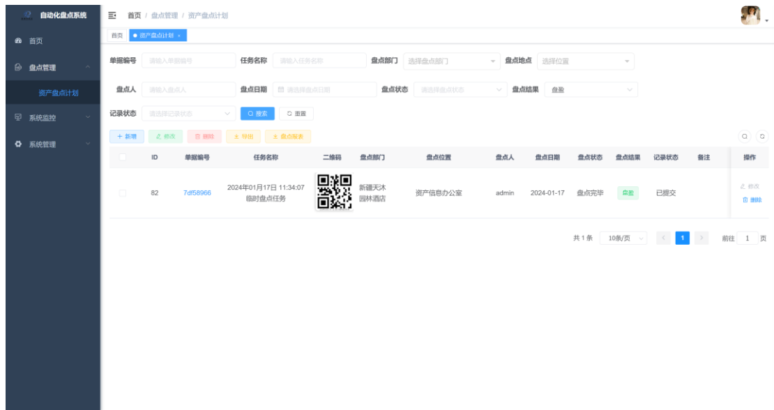
图 3-10 资产盘点计划过滤页面